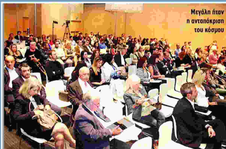
Μεγάλη ήταν η ανταπόκριση του κόσμου

Τιμώμενη περιοχή ήταν η Λέσβος που γράφει ιστορία με το προσφυγικό και το μεταναστευτικό, ενώ τις εργασίες έκλεισε ο υφυπουργός Εξωτερικών, Ιωάννης Αμανατίδης